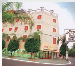
HOTEL LA POSADA