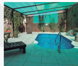
HOTEL PARAISO TERMAL

HOTEL LA POSADA ★★ HOTEL LOS OLIVOS ★★ HOTEL PARAISO TERMAL ★★