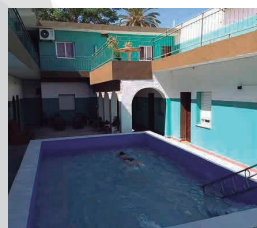
HOTEL LOS OLIVOS